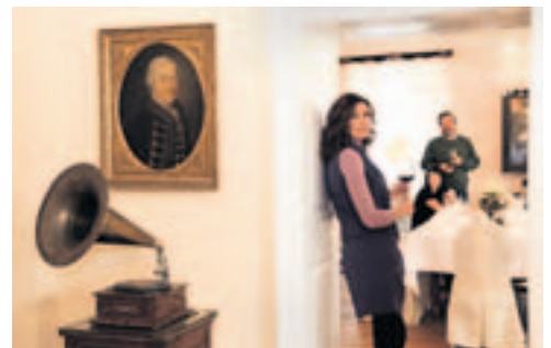
Herrschaftliches Ambiente im Schloss Lichtengraben im Kärntner Lavanttal. Perfekt abgestimmte Arrangements und Stilmöbel auf 1200 Quadratmetern