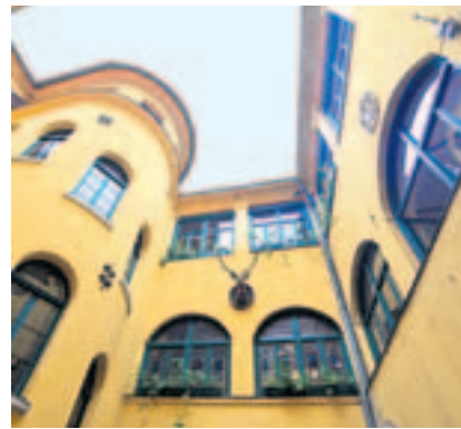
Stimmig: der historische Innenhof von Schloss Lichtengraben mit unzähligen Arkaden und Gewölben. Die Fassade: ein warmes Gelb